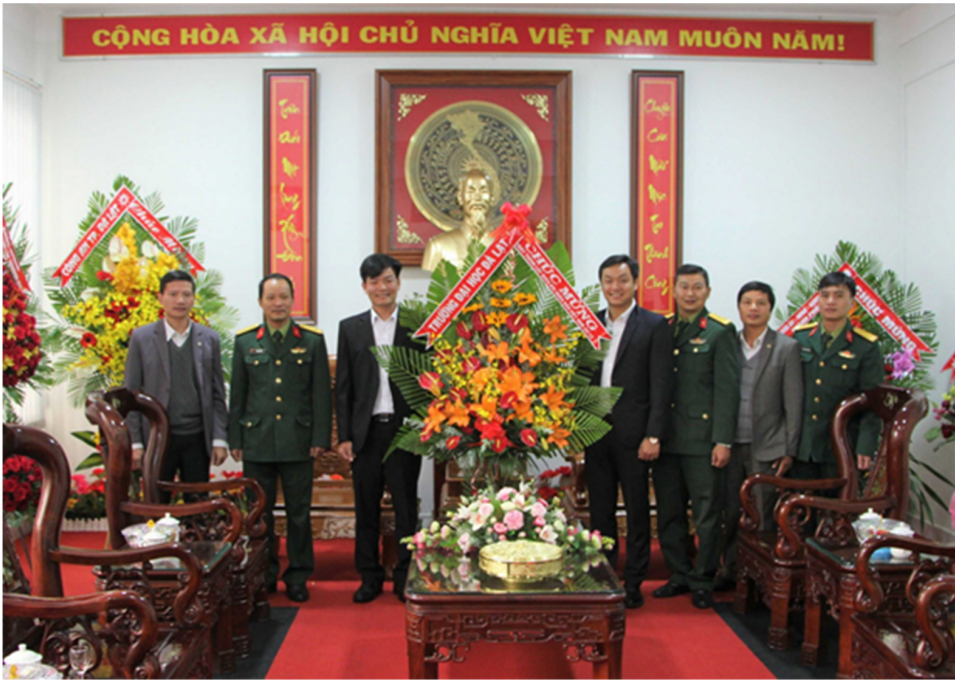
Đoàn công tác Trường Đại học Đà Lạt thăm và chúc mừng Bộ Chỉ huy Quân sự thành phố Đà Lạt