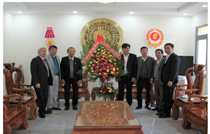
Đoàn công tác Trường Đại học Đà Lạt thăm và chúc mừng Hội Cựu chiến binh tỉnh Lâm Đồng

đoàn kết, giúp đỡ của bạn bè quốc tế, kế thừa và phát huy truyền thống quân sự của dân tộc, vừa chiến đấu vừa xây dựng, Quân đội Nhân dân Việt Nam ngày càng phát triển và trưởng thành.