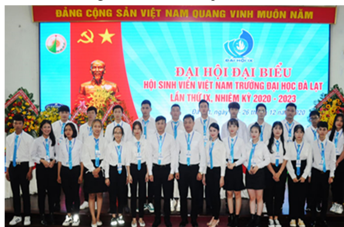
Ban Chấp hành Hội Sinh viên Việt Nam Trường ĐHQĐL khóa IX, nhiệm kỳ 2020-2023 ra mắt tại Đại hội