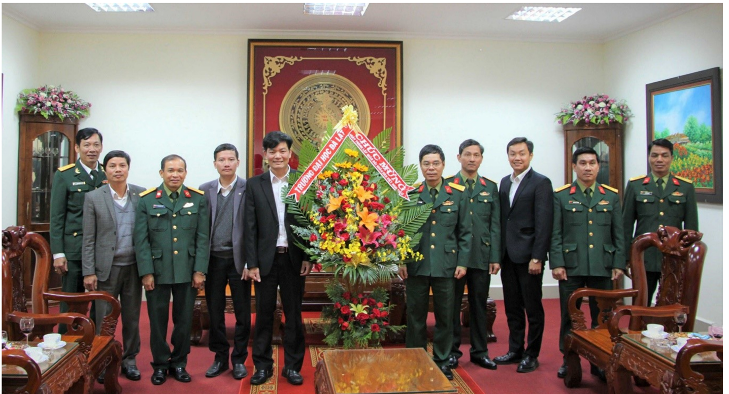
Đoàn công tác Trường Đại học Đà Lạt thăm và chúc mừng Bộ Chỉ huy Quân sự tỉnh Lâm Đồng

Quân đội Nhân dân Việt Nam là quân đội kiểu mới, quân đội của Nhân dân, do Nhân dân, vì Nhân dân, là lực lượng nòng cốt của lực lượng vũ trang Nhân dân Việt Nam, được Đảng Cộng sản Việt Nam và Chủ tịch Hồ Chí Minh tổ chức, giáo dục và rèn luyện. Trải qua 76 năm xây dựng, phát triển, chiến đấu và chiến thắng, dưới sự lãnh đạo của Đảng Cộng sản Việt Nam, sự đùm bọc và nuôi dưỡng của Nhân dân, sự