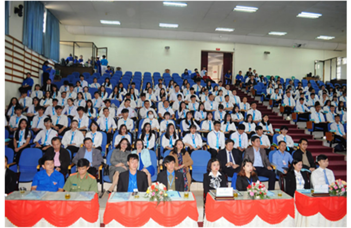
Các đại biểu tham gia Đại hội