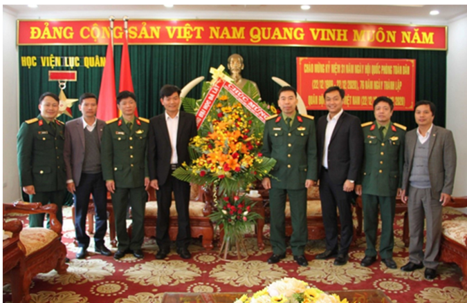
Đoàn công tác Trường Đại học Đà Lạt thăm và chúc mừng Học viện Lục quân Đà Lạt