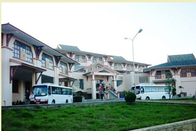
Trường Đại học Đà Lạt đã trở thành địa chỉ lựa chọn của sinh viên khu vực miền Trung, Tây Nguyên

Từ 3 năm nay, Trường Đại học Đà Lạt đã trở thành địa chỉ lựa chọn của sinh viên khu vực miền Trung, Tây Nguyên cho tới các tỉnh Nam Trung Bộ. Riêng năm học 2020-2021, trường đại học này đã tuyển sinh được tới trên 98% so với chỉ tiêu đặt ra.