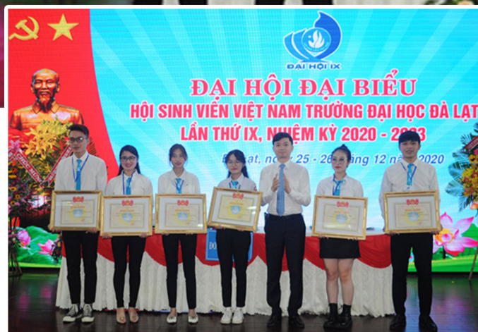
Ban Chấp hành Trung ương Hội Sinh viên Việt Nam trao bằng khen cho các tập thể và cá nhân