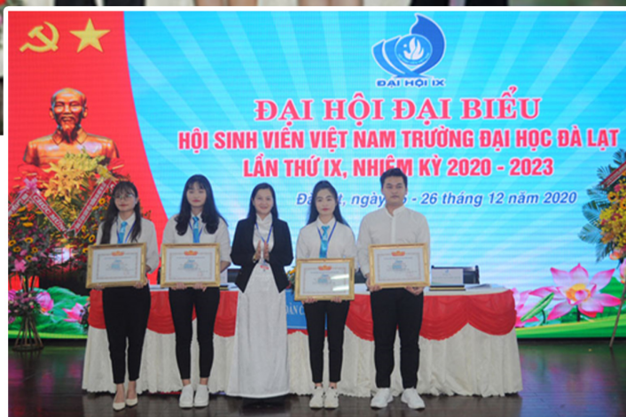
Hội Liên hiệp Thanh niên Việt Nam tỉnh Lâm Đồng trao bằng khen cho các tập thể và cá nhân