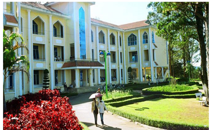
Cơ sở vật chất của ĐH Đà Lạt được đầu tư đồng bộ, hiện đại