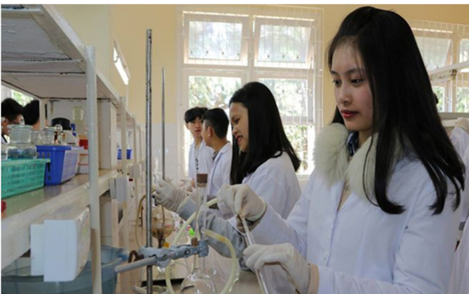
Chương trình đào tạo tại ĐH Đà Lạt phù hợp với nhu cầu thực tế