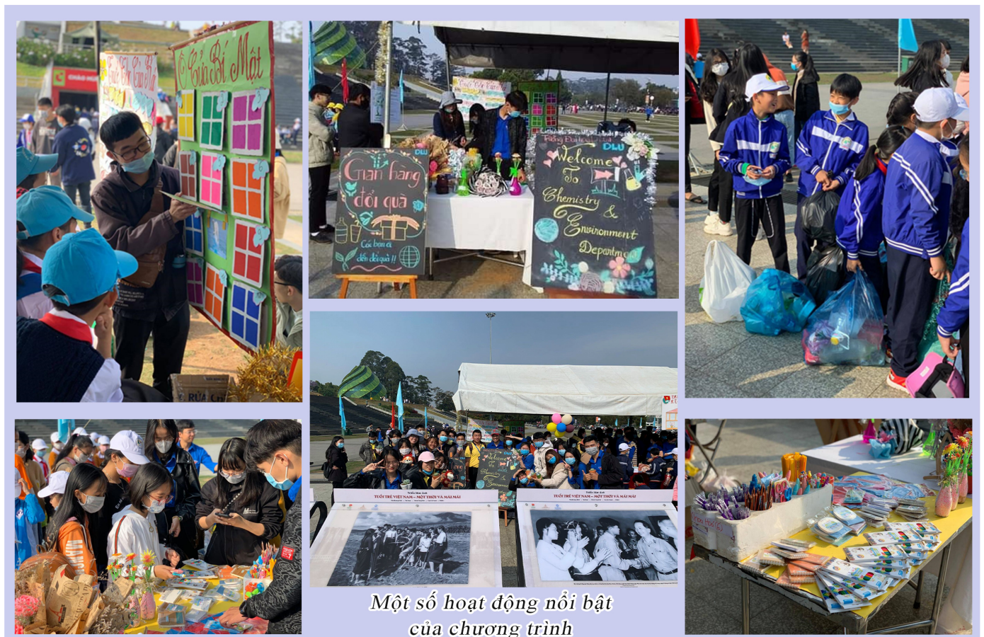
Một số hoạt động nổi bật của chương trình

Với hơn 200 hình ảnh, tư liệu lịch sử của các nhà báo, nghệ sĩ nhiếp ảnh nổi tiếng gồm: Mẫu Hoàng Thiết, Mai Nam, Đoàn Công Tính, Chu Chí Thành, Đỗ Kết đã tái hiện chân thực từng khoảnh khắc của những người chiến sĩ đã tận hiến thân mình trong cuộc chiến bảo vệ Tổ quốc, lay động trái tim các thế hệ người Việt và bạn bè quốc tế. Đó là những khoảnh khắc lịch sử hào hùng của dân tộc, của tuổi trẻ Việt Nam trong kháng chiến chống Mỹ ở miền Nam và xây dựng chủ nghĩa xã hội ở miền Bắc giai đoạn 1960-1975, khơi dậy lòng tự hào, biết ơn đối với các thế hệ cha ông đi trước, động viên tuổi trẻ hôm nay xây dựng hoài bão lớn, rèn đức, luyện tài, đoàn kết, xung kích, sáng tạo, xây dựng và bảo vệ Tổ quốc./.