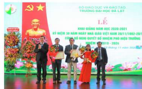
Thứ trưởng Bộ GD&ĐT trao Bằng khen cho các cá nhân đã có nhiều đóng góp xây dựng đơn vị góp phần vào sự nghiệp phát triển giáo dục

ủy, Hiệu trưởng Trường Đại học Đà Lạt đã thay mặt tập thể lãnh đạo Trường gửi đến toàn thể quý thầy cô giáo toàn trường những lời chúc mừng tốt đẹp nhất và bày tỏ sự tin tưởng rằng, trong thời gian tới, các thầy cô sẽ tiếp tục phát huy tinh thần tận tụy, đoàn kết, trách nhiệm, phát huy hết tiềm năng, sức sáng tạo để hoàn thành xuất sắc nhiệm vụ được giao, thực sự là một tấm gương sáng để sinh viên noi theo, góp phần cùng toàn ngành Giáo dục cả nước hoàn thành nhiệm vụ vinh quang của mình.