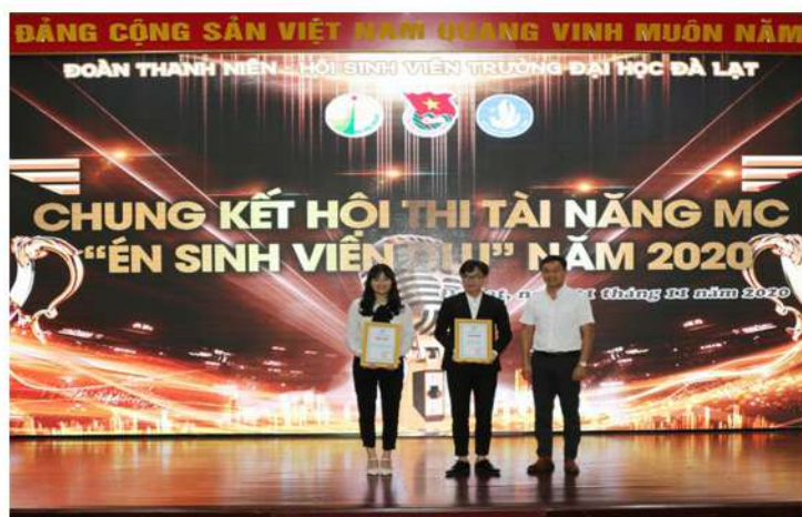
Hai thí sinh giành giải Nhì và giải Ba trong hội thi.