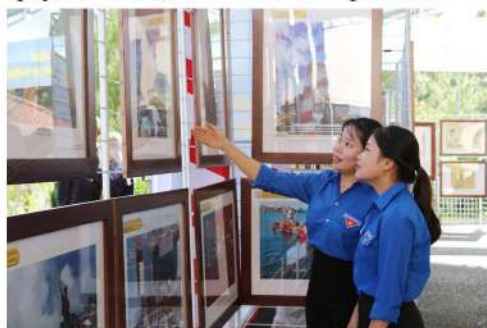
Các sinh viên đang tham quan, tìm hiểu về biển, đảo Việt Nam thông qua các hình ảnh tại buổi Triển lãm

Triển lãm bản đồ và trưng bày tư liệu “Hoàng Sa, Trường Sa của Việt Nam – Những bằng chứng lịch sử và pháp lý” tại Trường Đại học Đà Lạt sẽ trưng bày các tư liệu, văn bản, bản đồ, hình ảnh, hiện vật theo phương pháp truyền thống kết hợp phương pháp trưng bày dựa trên công nghệ thực tế ảo 3D bằng cách số hóa một số tư liệu có giá trị pháp lý cao. Ngoài ra, khách tham quan Triển lãm còn được trải nghiệm ứng dụng công nghệ thông tin trên máy tính bảng với các ứng dụng như: Chụp ảnh “Khoảnh khắc Trường Sa”, Sa bàn số 3D, trò chơi tương tác “Hành trình Trường Sa”, mô hình tàu 3D nhằm tăng cường tính trực quan, sinh động và hấp dẫn của Triển lãm, qua đó nâng cao hiệu quả tuyên truyền về chủ quyền biển, đảo Việt Nam. Thông qua Triển lãm cung cấp các thông tin, bằng chứng lịch sử, pháp lý về chủ quyền biển, đảo Việt Nam, khẳng định lập trường chính nghĩa của Việt Nam cũng như giới thiệu về hình ảnh đất nước, con người Việt Nam, đồng thời tuyên truyền về chủ quyền của Việt Nam đối với hai quần đảo Hoàng Sa, Trường Sa. Qua đó, nâng cao tinh thần đoàn kết, ý thức trách nhiệm của người dân, đặc biệt là đội ngũ cán bộ, giảng viên và sinh viên trong công cuộc bảo vệ chủ quyền biển, đảo của Tổ quốc./.