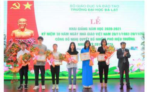
Trường Đại học Đà Lạt vinh danh các tân sinh viên là thủ khoa, á khoa trong kỳ thi tuyển sinh năm 2020

Trường Đại học Đà Lạt cũng vinh danh các tân tiến sĩ, các tân sinh viên là thủ khoa, á khoa trong kỳ tuyển sinh năm 2020.