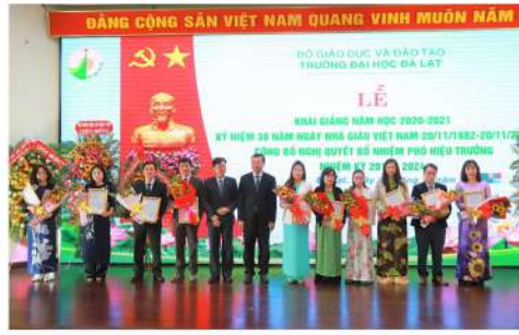
Cán bộ, giảng viên của Trường được nhận Kỷ niệm chương “Vì sự nghiệp giáo dục” của Bộ GD&ĐT