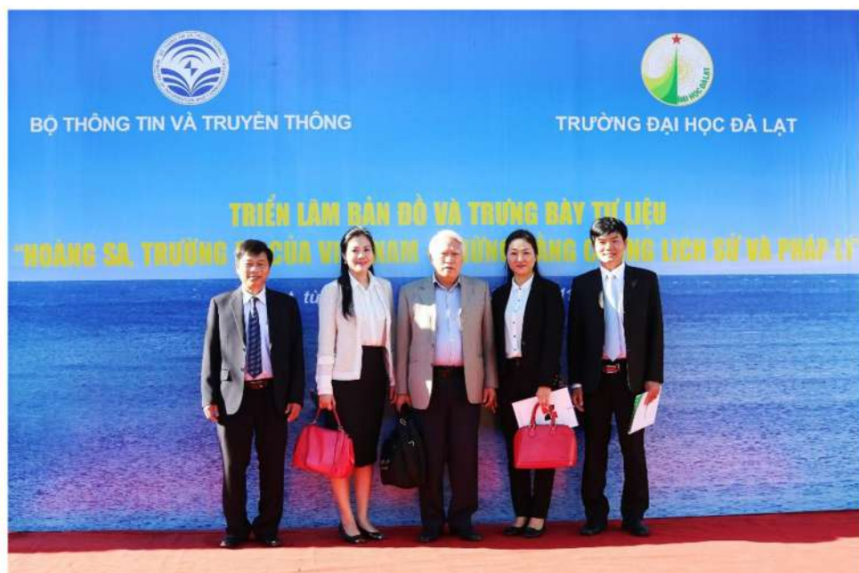
Đại biểu tham dự Lễ khai mạc Triển lãm bản đồ trưng bày tư liệu “Hoàng Sa, Trường Sa của Việt Nam – Những bằng chứng lịch sử và pháp lý”

Triển khai thực hiện Quyết định số 930/QĐ-TTg ngày 28/7/2018 của Thủ tướng Chính phủ phê duyệt Đề án tuyên truyền bảo vệ chủ quyền và phát triển bền vững biển, đảo Việt Nam giai đoạn 2018-2020, Bộ Thông tin và Truyền thông ban hành Quyết định số 211/QĐ-BTTTT ngày 14/2/2020 của Bộ trưởng Bộ Thông tin và Truyền thông về việc ban hành Kế hoạch triển khai thực hiện các nhiệm vụ tuyên truyền bảo vệ chủ quyền và phát triển bền vững biển, đảo Việt Nam năm 2020. Theo đó, Bộ Thông tin và Truyền thông phối hợp với Trường Đại học Đà Lạt tổ chức Triển lãm bản đồ và trưng bày tư liệu “Hoàng Sa, Trường Sa của Việt Nam – Những bằng chứng lịch sử và pháp lý” từ ngày 16/11 đến ngày 18/11 năm 2020 tại Thư viện Trường Đại học Đà Lạt.