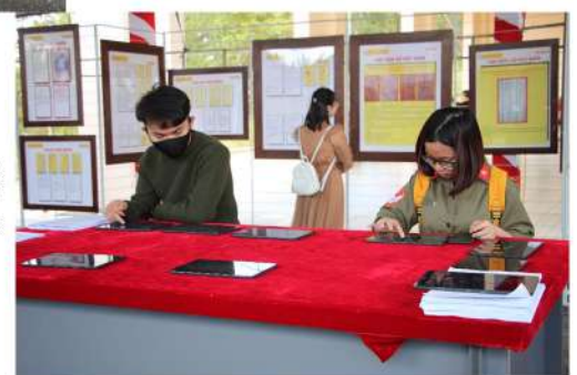
Các sinh viên đang trải nghiệm các ứng dụng tìm hiểu về biển, đảo Việt Nam trên máy tính bảng