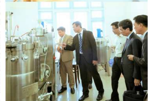
Thứ trưởng Bộ GD&ĐT tham quan khuôn viên, Bảo tàng Côn trùng và Phòng thí nghiệm công nghệ giống cây trồng thuộc bộ phận công nghệ vi sinh nông nghiệp của khoa Sinh học, Trường Đại học Đà Lạt