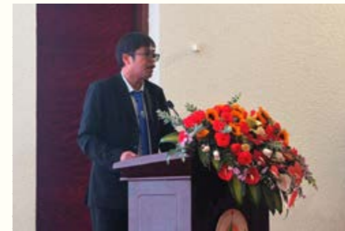
hoc Đà Lạt.