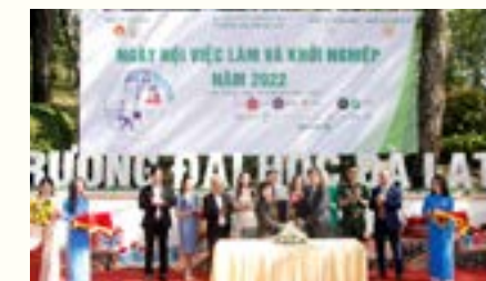
Phòng Tạp chí và Truyền thông