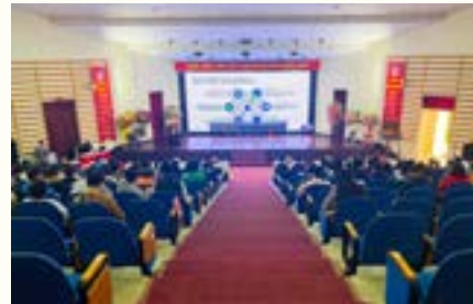
Phòng Tạp chí và Truyền thông

Tại sự kiện, các chương trình đào tạo của Cisco Networking Academy, AWS Academy, cũng như các chương trình đào tạo ngắn hạn khác của Trung tâm CNTT đã được giới thiệu. Đây là những khóa học dựa trên nền tảng công nghệ mới, đào tạo những kỹ năng cần thiết nhằm đáp ứng các yêu cầu đa dạng về nhân lực công nghệ thông tin hiện nay. Đồng thời, Cuộc thi “Sáng tạo phần mềm năm 2022” của Khoa CNTT đã được phát động với mục đích tìm ra những sinh viên tài năng, bồi dưỡng và phát huy tối đa khả năng sáng tạo, tư duy và đam mê trong lập trình ứng dụng của họ. Ban tổ chức cũng đã trao giải cho các nhóm sinh viên đạt thành tích tốt trong cuộc thi “Sáng tạo phần mềm năm 2021”.